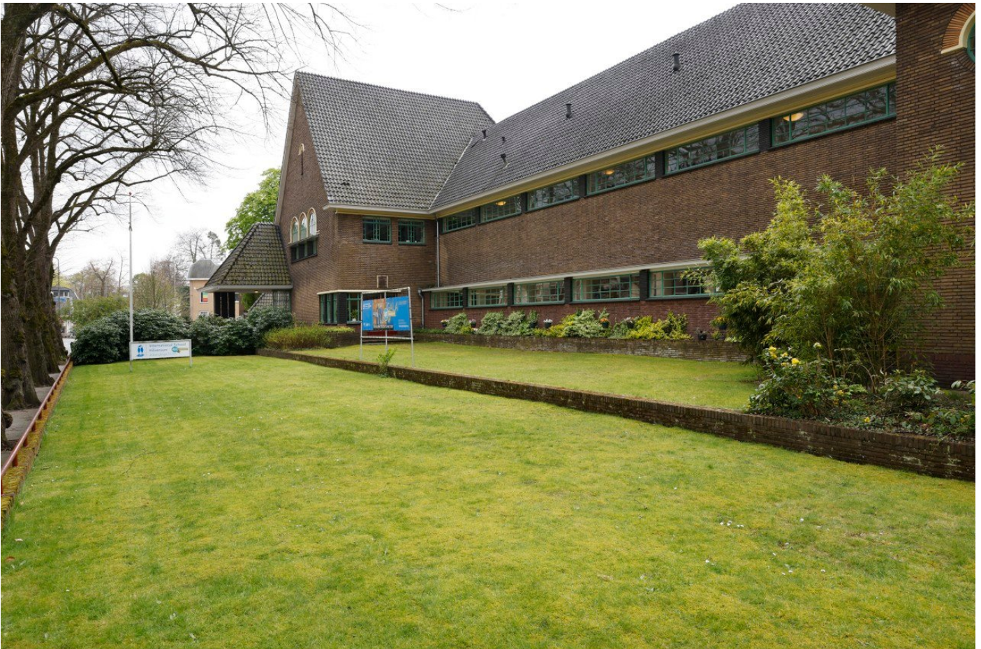
De International School aan de Emmastraat 56.